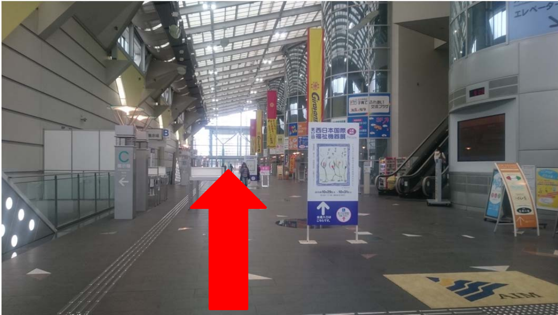
西日本国際展示場を通り抜け、突き当たりの右手のエスカレーターで、地上に降ります。